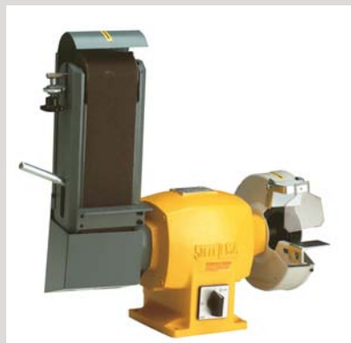
DIMENSIONES EN mm.